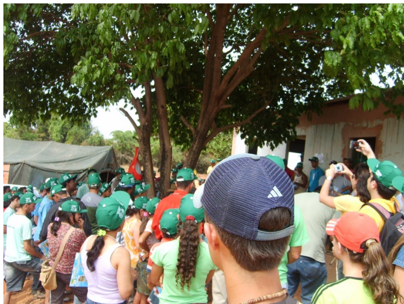
Figura 1- Dia de Campo Agroecológico realizado pela Turma de Mestrado em Agroecologia, Março de 2009, Comunidade de Planalto Rural