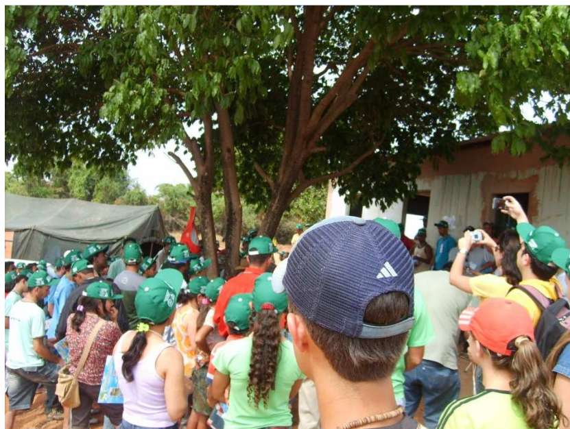
Figura 1- Dia de Campo Agroecológico realizado pela Turma de Mestrado em Agroecologia, Março de 2009, Comunidade de Planalto Rural